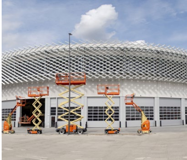
Club Brugge investeerde in 'The Nest', het vroegere Schiervelde in Roeselare, waar de belofteploeg zijn wedstrijden in 1B afwerkt.