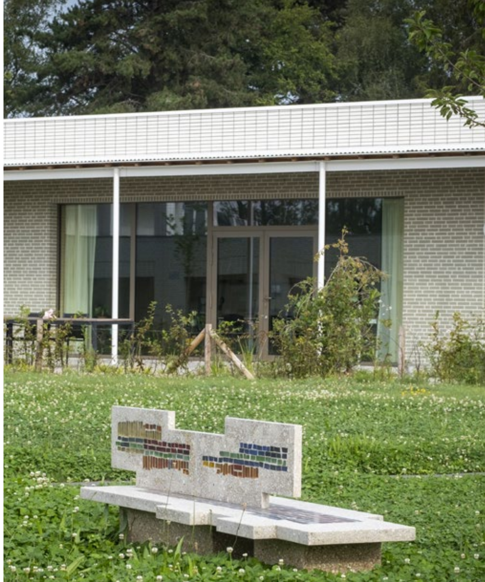
In Gits bouwde school en zorgaanbieder Dominiek Savio een basisschool en multifunctioneel centrum.

Het nummer tien van de ranking is ook actief in de gezondheidszorg, met name het Psychiatrisch Ziekenhuis Sint-Jozef in Pittem. Deze organisatie is al een tijdje bezig met de uitvoering van een masterplan dat heel wat ingrijpende infrastructurele veranderingen inhoudt. Sint-Jozef wil een helende omgeving creëren waar de fysieke omgeving het welbevinden van de patiënt bevordert: maximaal contact met de natuur, veel