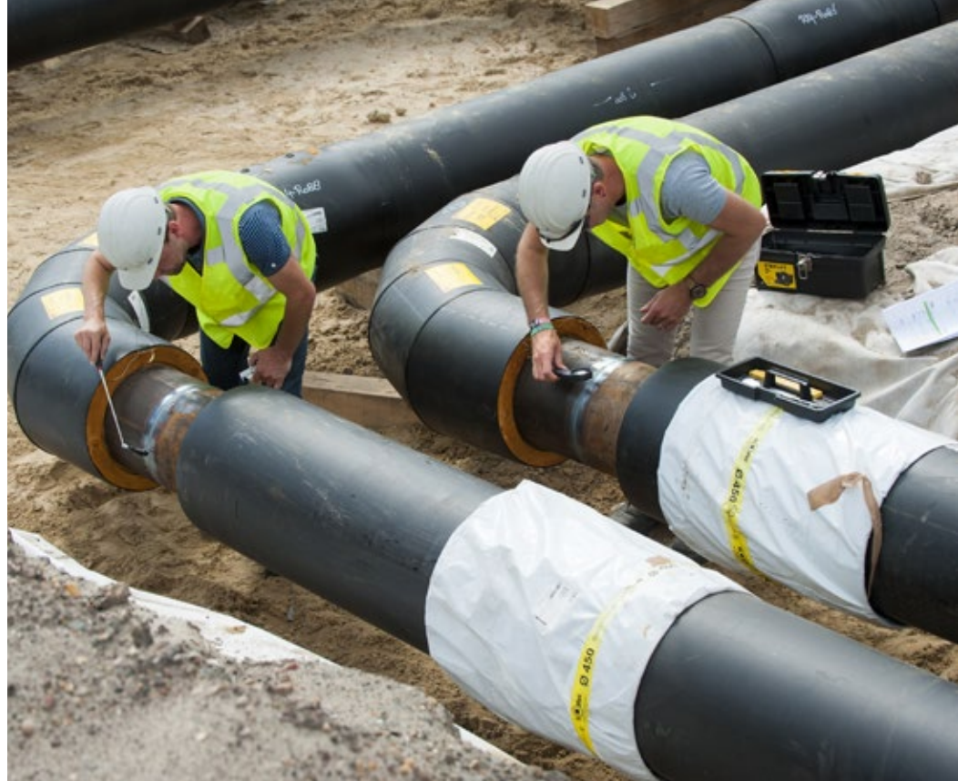
Gaselwest, een van distributienetbedrijven die onder Fluvius vallen, investeerde ruim 116 miljoen euro. "Het gaat onder andere over elektriciteits- en gasnetten en warmteprojecten", zegt woordvoerder Lara Lammens.

De derde en laatste podiumplaats gaat naar de Intercommunale Maatschappij voor Gas en Elektriciteit van het Westen, beter bekend als Gaselwest. Dat is één van de elf Vlaamse distributienetbedrijven die onder Fluvius vallen. Het totale investeringsbedrag bedraagt meer dan 116 miljoen euro en valt uiteen in verschillende posten. "Het gaat onder andere over